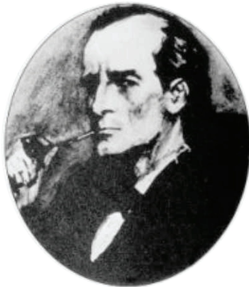
Den klassiske Holmes-profil, tegnet af Sidney Paget til de oprindelige historier